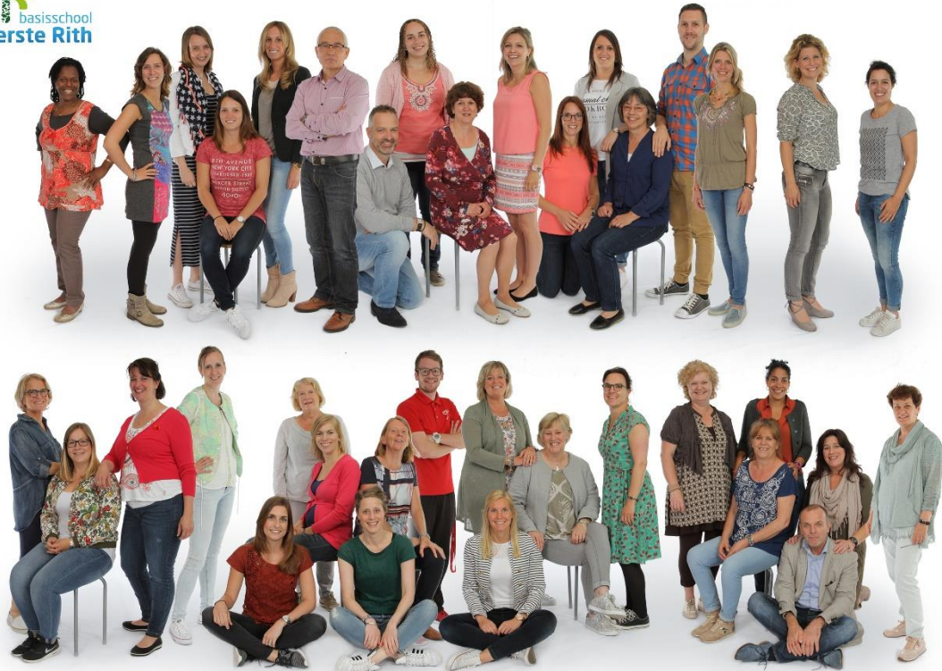
KBS De Eerste Rith 2015-2016